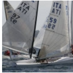
Finn al giro di boa (clicca per ingrandire)